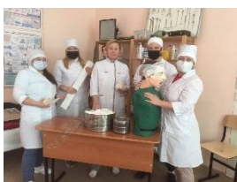
«Выбор профессии – дело серьезное»